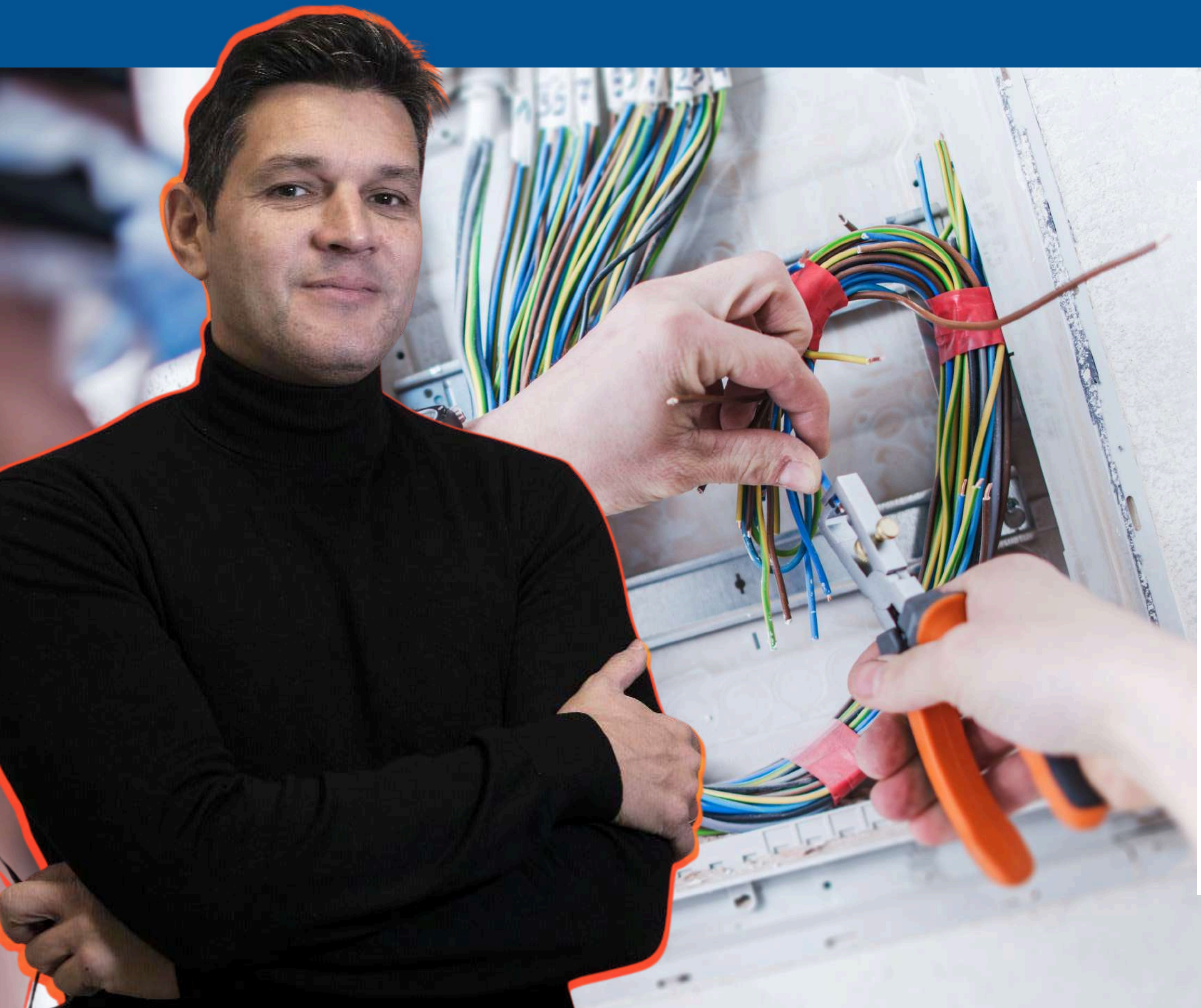
MATTEO DIDDI PRESIDENTE FEDERAZIONE IMPIANTI